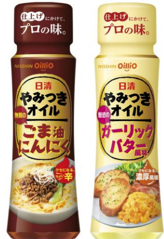
画像ダウンロード

◆色々な料理で楽しめることをお伝えするため、おすすめ料理を載せた全 10 種類のパッケージをご用意しました。