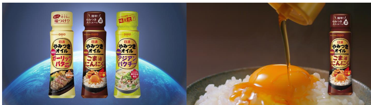
日清やみつきオイル『うまいオイル誕生』篇より

当社では、「オイルで味つけ」という、新たな使い方を提案する「味つけオイル」を発売し、その市場創造への取り組みを通じて、お客さまの「おいしさ」への期待にお応えするとともに、食のマナー化の解消や、個人の好みに合わせた味つけなどのニーズにお応えしています。