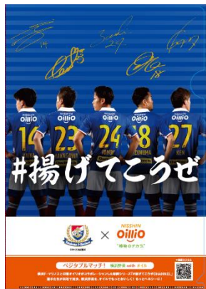
クリアファイル 表面

先着2万名様に選手のサイン入りクリアファイルをプレゼント！当日会場の入口で、お受け取りいただけます。 ※ホーム側のみでのお渡しとなります。