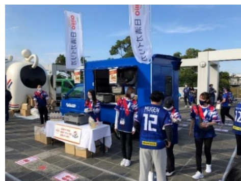
2021年ブース出展の様子