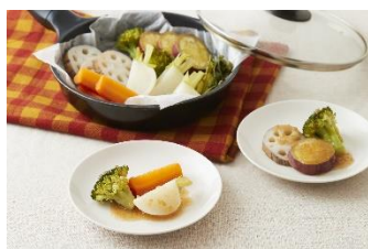
ドレッシングで食べる蒸し野菜