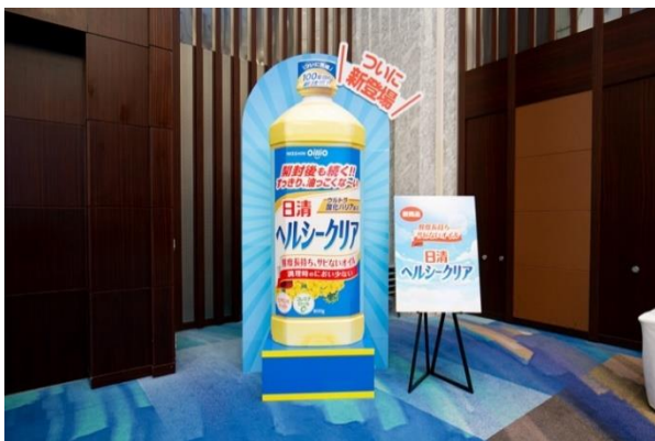
画像ダウンロード