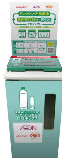
回収ボックスイメージ