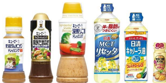
回収対象商品一例