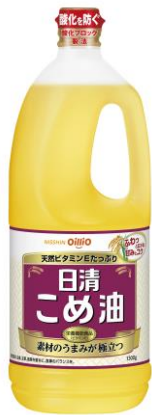
画像ダウンロード

家庭用のこめ油は、特に近年、生活者の健康意識の高まりから市場規模が拡大すると共に、特に中大容量タイプの販売が好調に推移しています。好評発売中の「日清こめ油 600g および 800g」に加えて 1300g を発売することで、より多くの生活者のニーズに応え、こめ油マーケットの更なる活性化を図ります。