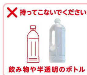
画像ダウンロード

なお、今回の回収実証実験で回収された油付きPETボトルは今後の技術検証に活用していく予定です ※2 。