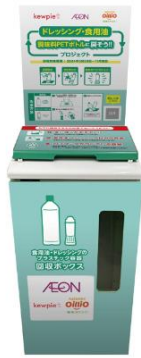
画像ダウンロード