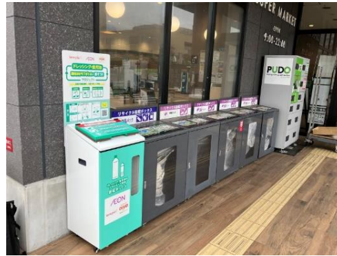
画像ダウンロード