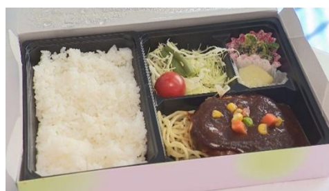
当日提供された弁当