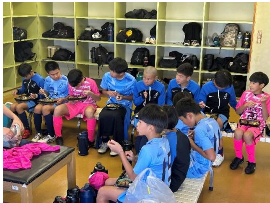
都道府県大会の様子