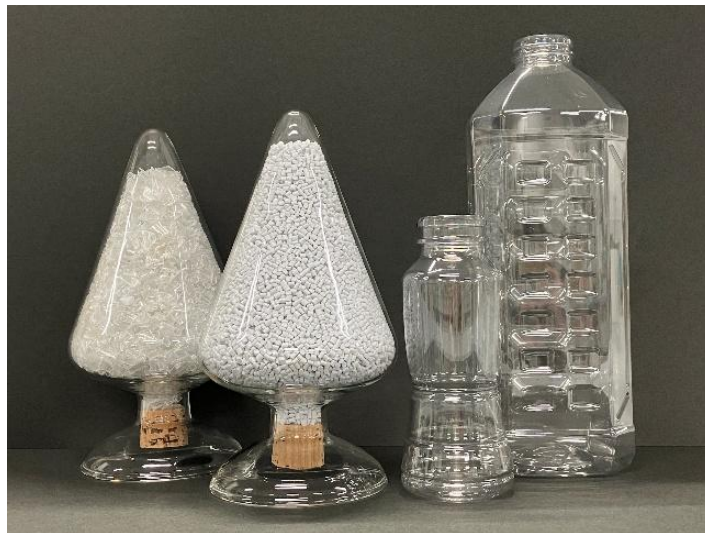
画像ダウンロード